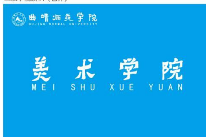
二级学院旗帜（艺体）